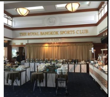
ビュッフェライン