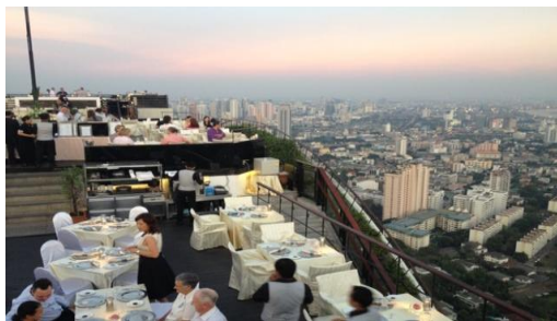
セットアップ一例