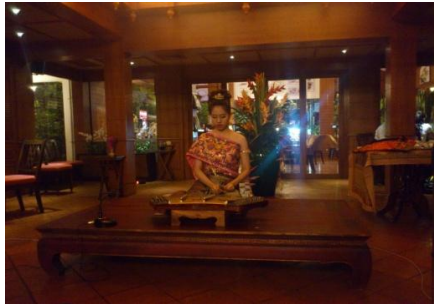
タイ伝統音楽(オプション)