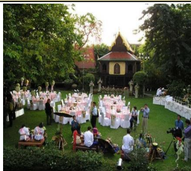
セットアップ一例