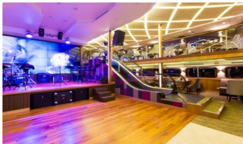
船内（エアコン有り）