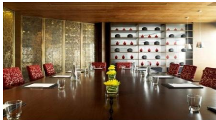
Altitude's Library Room