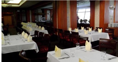
セットアップ一例