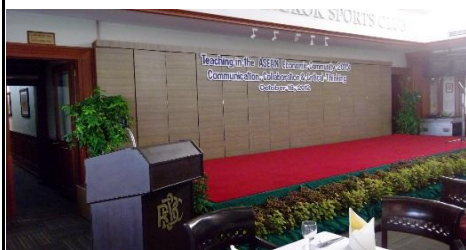
ステージ設置イメージ