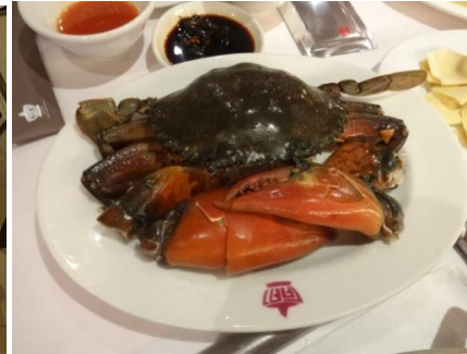
アラカルト一例(活き蟹)