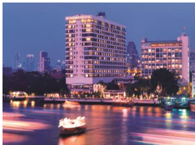
チャオプラヤ川景観