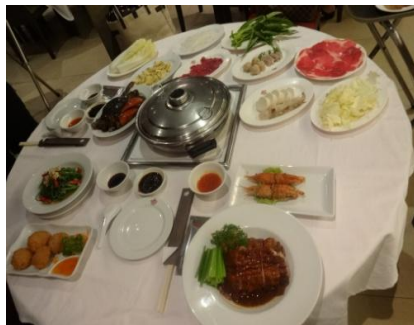
セットメニューの一例