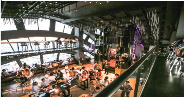
セットアップ一例