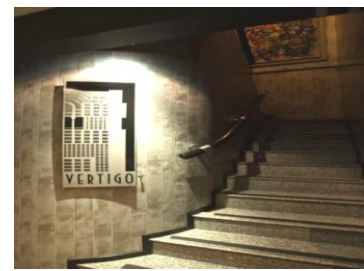
ヴァーティゴへの入口