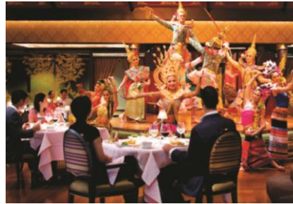
タイ舞踊を観ながらのお食事