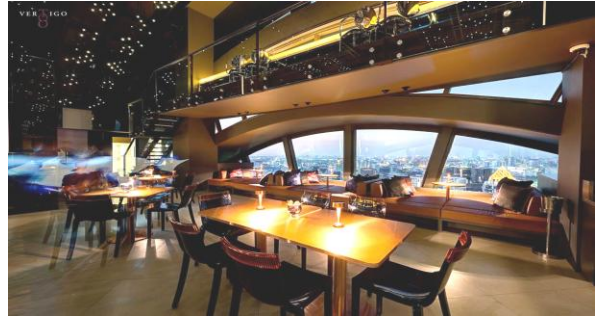
セットアップ一例