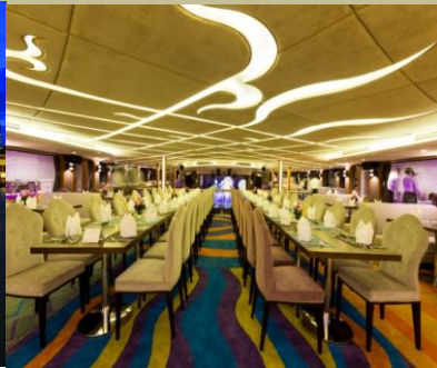
船内（エアコン有り）