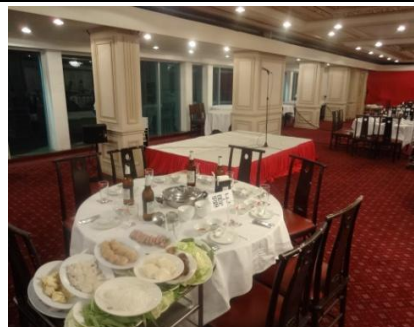
テーブルセットアップ