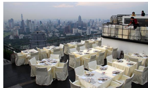
セットアップ一例