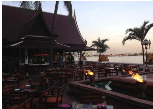
会場セットアップ一例