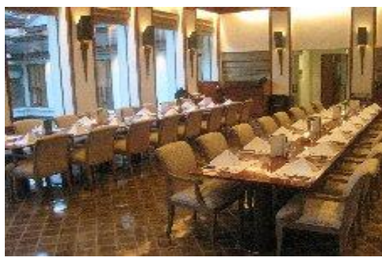
会場セットアップ一例