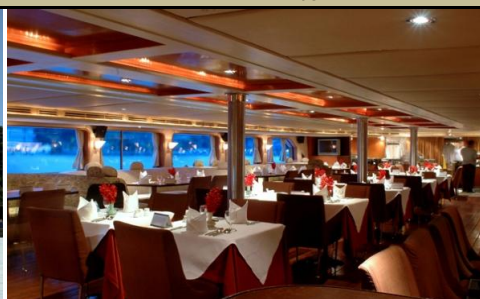
船内 (エアコン有り)