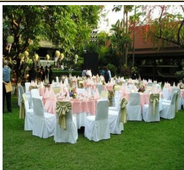
セットアップ一例