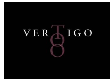
ヴァーティゴトウ ロゴ