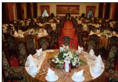
Khanh Tiet Hall（カンティエットホール）