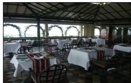
25階トップ オブ ザ タウン