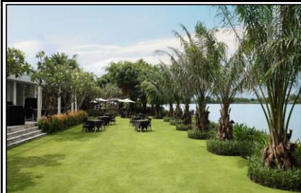
パティースペース