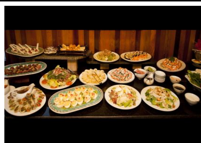
インターナショナルbuffet