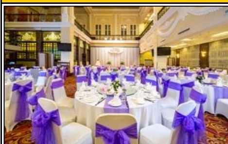
ガンディンクラブ1