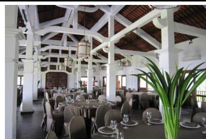
バックアップルーム