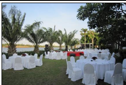
パーティーセットアップ