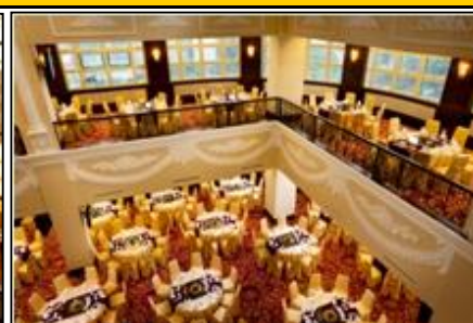
ガンディンクラブ3