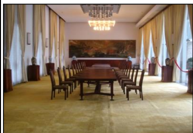
Dai Yen Hall（ダイイェンホール）