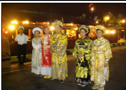
王族衣装達によるお出迎え