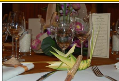
食事のセットアップ