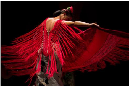
フラメンコダンス（イメージ）