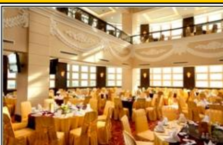
ガンディンクラブ2