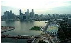
(ゴンドラからの日中の眺め)