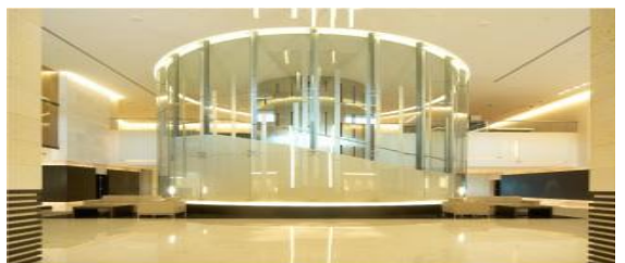
専用ラウンジ入口