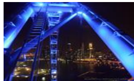
(ゴンドラからの夜景)